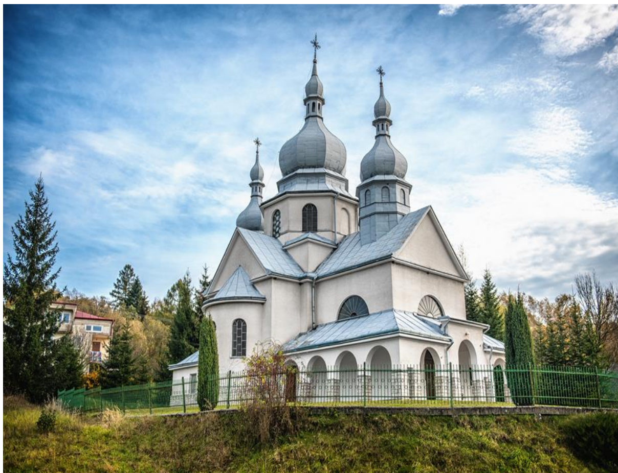
Kościół pw. Nawiedzenia NMP w Tarnawce