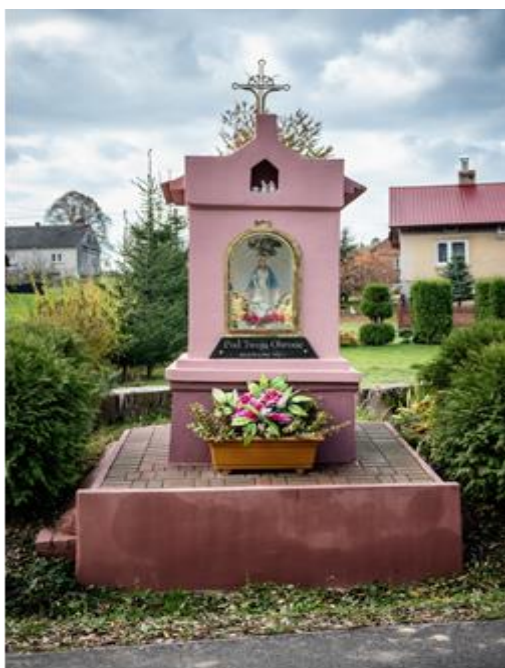
Zabytkowa kapliczka w Tarnawce, własność prywatna.