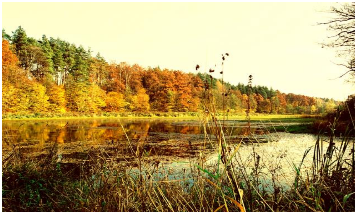
Tereny rekreacyjne- stawy w Tatnawce