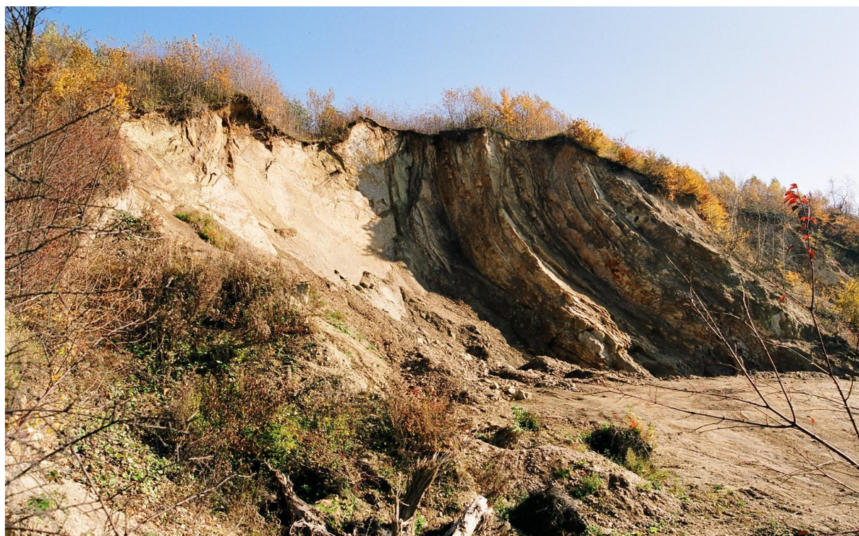
Nieczynny kamieniołom w Tarnawce