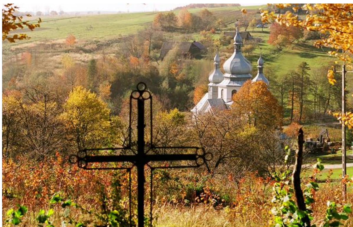
Panorama Tranawki- widok Kościoła pw. Nawiedzenia NMP