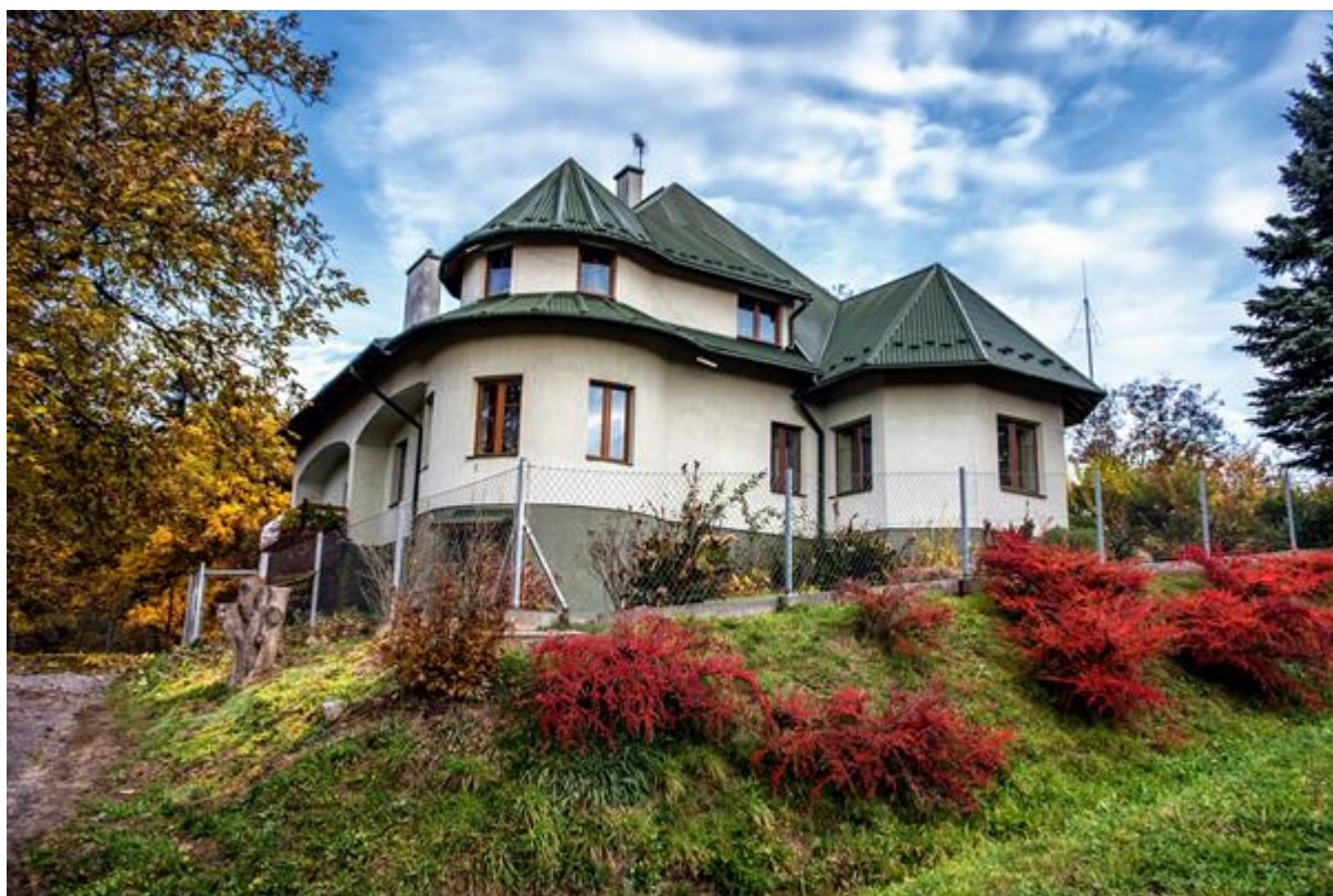
Leśniczówka – dawny pałac myśliwski