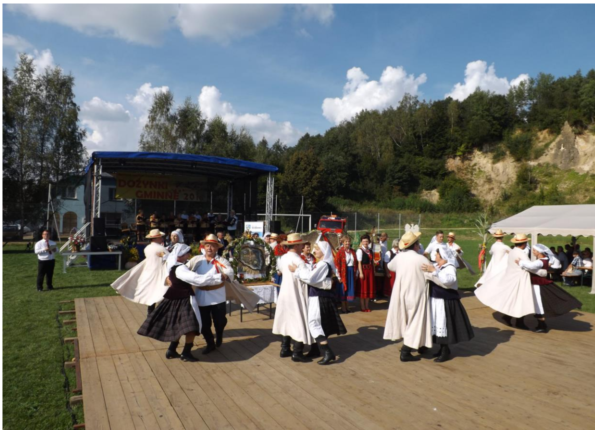
Dożynki gminne 2018–Tarnawka